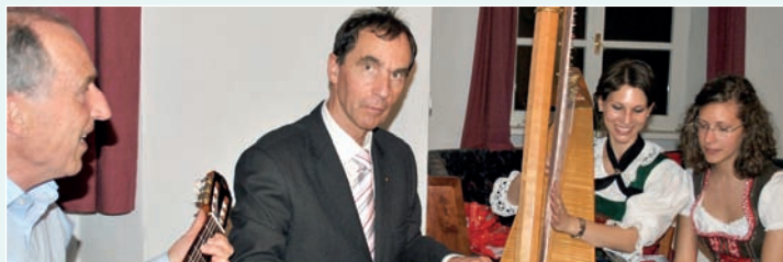
... und musiziert