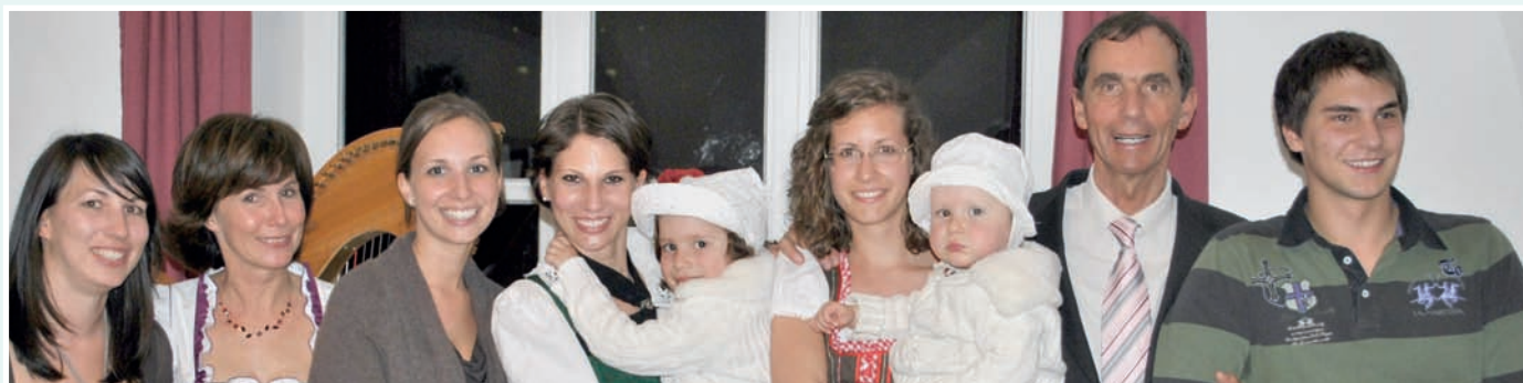
Die Familie Plattner